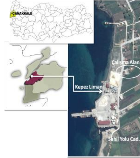
Şekil 1. Çalışma Alanı Konumu

Çalışmanın yapılacağı alan, Çanakkale İli'ne bağlı Kepez İlçesi sınırları içerisinde Çanakkale Esnaf ve Sanatkarlar Kredi ve Kefalet Kooperatifi'ne ait sosyal tesisin (Şekil 1 ve 2).