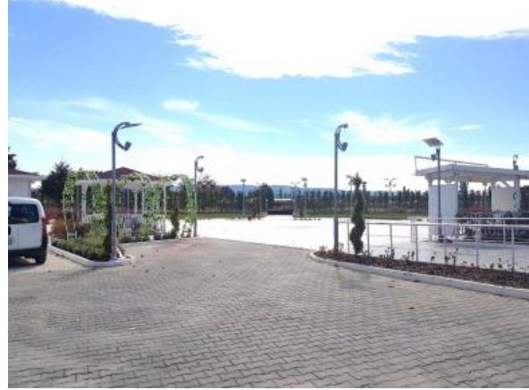
Şekil 5. Uygulama Sonrası Karşılama Alanından Görünüş

Tüm bu seçimler doğrultusunda hazırlanan peyzaj projesinin uygulanabilmesi amacıyla, projenin yaklaşık maliyeti hesaplanmış, yüklenici firmanın belirlenmesi sonucunda uygulama çalışmalarına başlanmıştır. Tüm bu aşamalar, Tablo 1’de belirtilen alanda yer alması planlanan kullanımlar ve bu kullanımların tasarımını yönlendiren öğeler ve tasarım özellikleri çerçevesinde yürütülmüştür. Uygulama çalışmaları Haziran 2016’da tamamlanmış (Şekil 5) ve alan düğün ve diğer sosyal etkinlikler amaçlı kullanılmaya başlanmıştır.