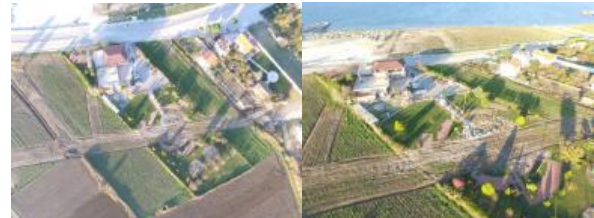
Şekil 2. Çanakkale Esnaf Ve Sanatkarlar Kredi Ve Kefalet Kooperatifi 'ne Ait Sosyal Tesis'in İmar Planına Uygun Yol Geçtikten Sonraki Durumuna Ait Hava Fotoğrafları

Tesis açık ve kapalı alanlar olmak üzere yaklaşık 7750 m 2 büyüklüğünde bir arazi üzerinde konumlandırılmıştır. Açık alan hava şartlarının uygun olması durumunda düğün organizasyonları için kullanılmaktadır. Kepez Belediyesi imar planına göre alanın orta noktasından geçen yol nedeni ile kullanım alanlarında azalma oluşmuştur (Şekil 3). Bu nedenle düğün organizasyonları için ayrılan alan işlevsel kullanım sağlamak amacı ile tekrar tasarlanmıştır. Yaklaşık 3000 m 2 lik alan için fonksiyonellik ön planda tutularak peyzaj projesi çizilmiş ve uygulanmıştır.